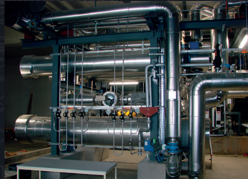
Sous-station Eau Surchauffée MOUTON DUVERNET (Quartier Part-Dieu – Ville de Lyon)